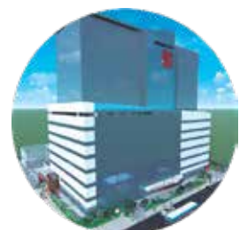
Perspectiva novo hospital