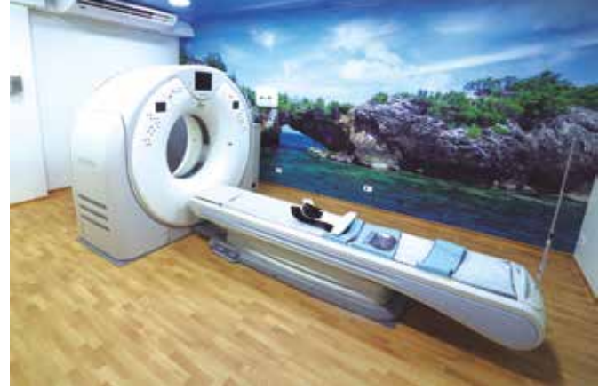
Sala de Tomografia

Referência na área da saúde, com destaque para o atendimento humanizado e o uso de tecnologia de ponta, o Hospital IGESP está apto a atender diversas áreas da medicina, dos mais simples aos mais complexos procedimentos clínicos e cirúrgicos. Especializado no atendimento de alta complexidade, o Hospital IGESP é referência em cirurgia cardíacas, neurológicas, oncológicas e ortopédicas, além de cirurgia bariátrica e outras especialidades.