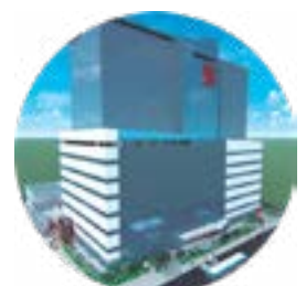
Perspectiva novo hospital