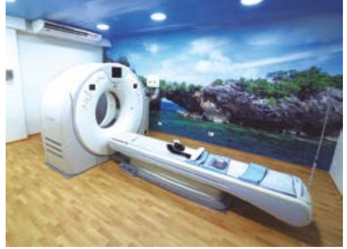
Sala de Tomografia

Referência na área da saúde, com destaque para o atendimento humanizado e o uso de tecnologia de ponta, o Hospital IGESP está apto a atender diversas áreas da medicina, dos mais simples aos mais complexos procedimentos clínicos e cirúrgicos. Especializado no atendimento de alta complexidade, o Hospital IGESP é referência em cirurgia cardíacas, neurológicas, oncológicas e ortopédicas, além de cirurgia bariátrica e outras especialidades.